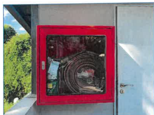
ระบบแจ้งเตือนอัคคีภัยและป้องกันอัคคีภัยภายในโครงการ