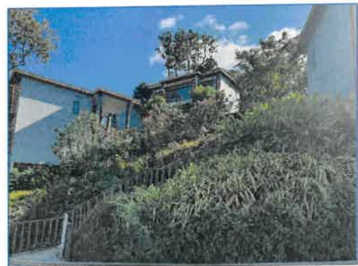
พื้นที่สีเขียวของโครงการ