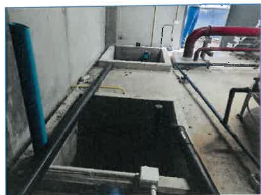
อาคารปรับปรุงคุณภาพน้ำ