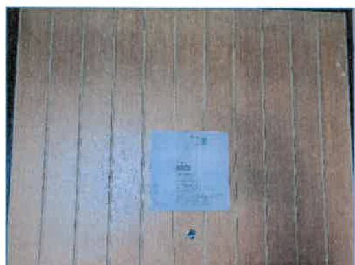
จุดรวมพลของโครงการ