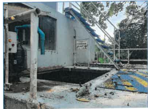
ระบบคลอรีน