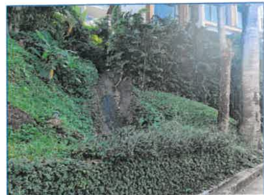
ระบบระบายน้ำฝน