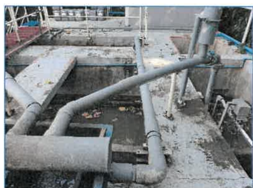
ระบบบำบัดน้ำเสีย