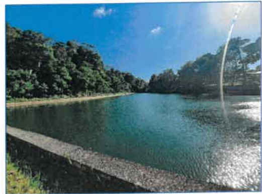
แหล่งน้ำดิบของโครงการ